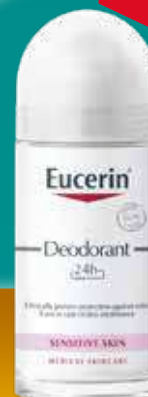
EUCERIN pH5 dezodorants jutīgai ādai 50 ml