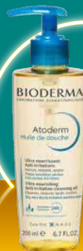
BIODERMA Atoderm dušas eļļa 200 ml