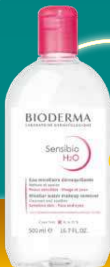
BIODERMA Sensibio H2O attīrošs micelārais ūdens jutīgai ādai 500 ml