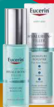
EUCERIN Hyaluron-Filler Moisture Booster intensīvi mitrinošs serums 30 ml