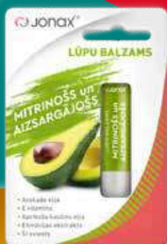
AVOKADO MITRINOŠS UN AIZSARGĀJOŠS lūpu balzams 4.5 g