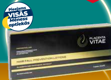
PLACENTA VITAE losjons pret matu izkrišanu 10 ml N12