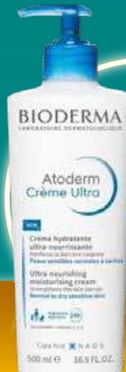
BIODERMA Atoderm Crème Ultra barojošs krēms sausas ādai 500 ml