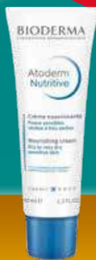
BIODERMA Atoderm Nutritive barojošs sejas krēms 40 ml